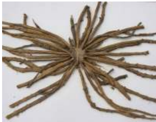
A. macrocarpa wortelstelsel

Ons het 'n foto van die plant na Kirstenbosch gestuur waar dit groot belangstelling ontlok het en gelei het tot 'n besoek deur die plantkundige wat met hierdie groep plante gewerk het, Anthony Magee. Met sy studie van die materiaal in sy natuurlike omgewing, asook van plante uit 'n ander plantpopulasie wat ons daar naby gevind het, het Anthony tot die gevolgtrekking gekom dat ons nie een nie, maar twee spesies ontdek het. 'n Paar plante van elke soort is versigtig uitgegrawe en Kirstenbosch toe geneem vir verdere kweeking om deeglik bestudeer te kan word.