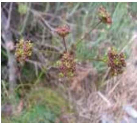
Annesorhiza sp. (onbekend)

Een plant het egter ons aandag getrek: 'n blaarloose stingel met 'n bloeiskerm van klein blommetjies, feitlik onmoontlik om waar te neem teen die naakte sand waarin dit gegroei het. Ons het dit geïdentifiseer as Annesorhiza , spesie onbekend. Die Fernkloofherbarium het oor net een voorbeeld beskik wat egter nie geïdentifiseer kon word nie en die Kuserherbarium, saamgestel deur oorlede Sheila Williams, het 'n voorbeeld van Annesorhiza macrocarpa met 'n skouspelagtige wortelstelsel. Dit was nie ons plant nie.