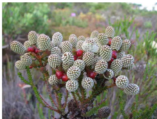
Berzelia abrotanoides met rooi aanhangsel